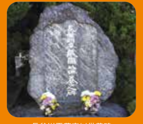
長谷川平蔵宣以供養碑

江戸時代の風情が、現代の街並みのなかにとけこむ四谷。江戸の歴史や文化に触れられるスポットをめぐっていると、都心にいなながらゆったりとした時間の流れが感じられるだろう。