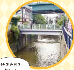
妙正寺川をわたり下落合方面へ

とんかつ たかはし 新宿区上落合2-6-3 ☎03-3368-7846 MAP P.18-19 B-3