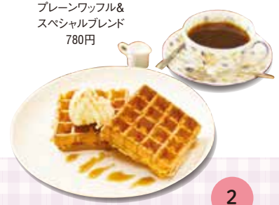
プレーンワッフル&スペシャルブレンド 780円