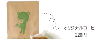
オリジナルコーヒー 220円