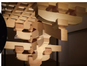
日本传统木造建筑博物馆