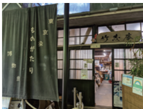
东京印染故事博物馆

用剪成小块的丝绸制作而成的发饰，称作发簪。东京染小纹和江户更纱在传统的基础上加入了现代元素日本建筑的传统技术-木造建筑。能感受到日本传统技术的三楼小型博物馆。还能参观和体验各种讲座。(要事先咨询)