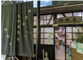
東京印染故事博物館

用剪成小塊的絲綢製作而成的髮飾，稱作髮簪。東京染小紋和江戶更紗在傳統的基礎上加入了現代元素日本建築的傳統技術—木造建築。能感受到日本傳統技術的三樓小型博物館。還能參觀和體驗各種講座。(要事先諮詢)