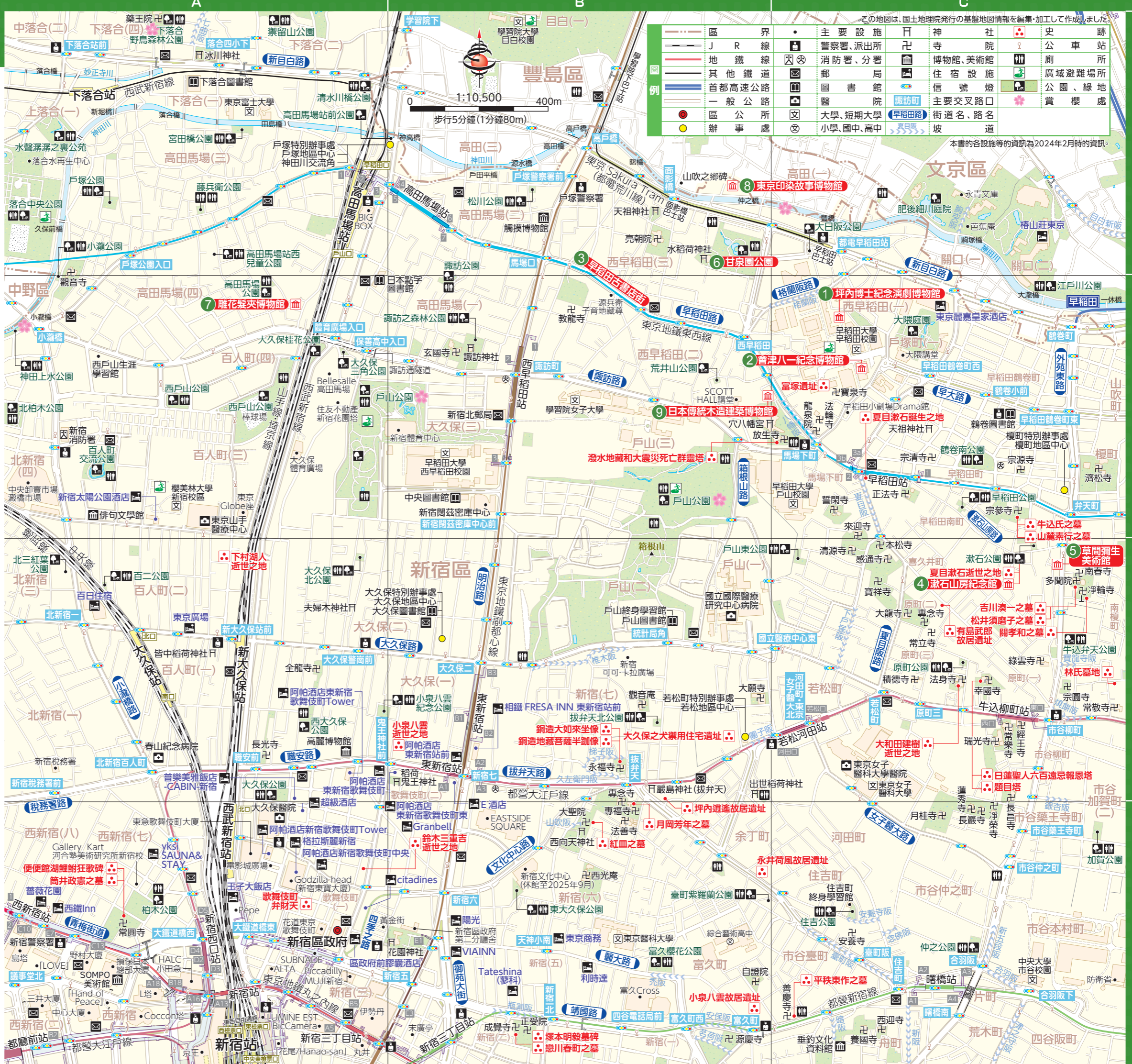
本書的各設施等的資訊為2024年2月時的資訊。

大久保周邊地區，戰前居住著多位德國音樂家和日本古典音樂家，以「音樂之城」、「樂器之城」聞名。現在依然有眾多的老字號樂器專賣店和二手樂器店、藝術工作室等，海外藝術家來日本時也經常到訪此處。此外，以管弦樂器為主的樂器修理店和工作室也為數眾多，活躍著一批技藝高超的名匠。