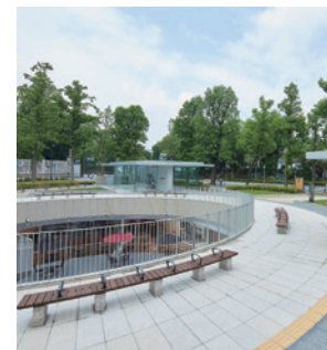
迎賓館赤坂離宮前休息場所

位於四谷站附近，是一個中間夾著林蔭道、左右對稱的三角形公園。以前，在綠色草坪旁邊有白色的柱子和噴泉等。沿著林蔭道前行，景色壯觀的迎賓館就映入眼簾。現在，公園內有配有咖啡廳、商店、無障礙衛生間等的迎賓館赤坂離宮前休息場所。