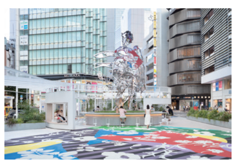
15 「하나오/Hanao-san」 (아트 제작/감수: 마츠야마 토모카즈) 광장설계: sinato 사: 오오타 타쿠미