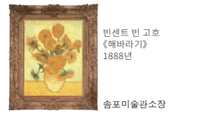
빈센트 반 고흐 《해바라기》 1888년 솜포미술관소장

신주쿠구 니시신주쿠 1-26-1 ☎03-5777-8600 ㉠유료 신주쿠역 서쪽 출구 JR / 게이오 / 오다큐 / 지하철 니시신주쿠역-도초마에역(지하철)에서 도보 5분