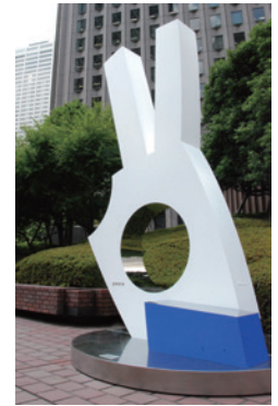
14 「Hand of Peace」 (제작자: 카마타 케이우)