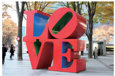
13 「LOVE」 (제작자: 로버트 인디애나)

야외 공공장소에서 누구나 부담 없이 감상할 수 있는 퍼블릭 아트. 신주쿠역 주변에는 수많은 퍼블릭 아트가 설치되어 있어 약속 장소나 포토 스팟으로 많은 사람들에게 사랑받고 있습니다.